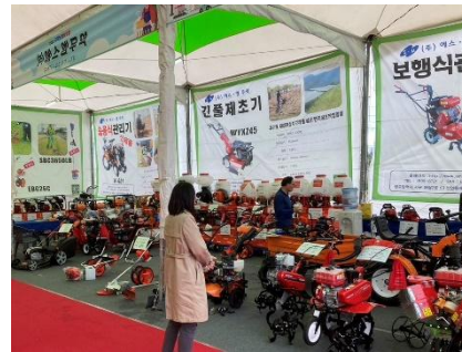
韓国の展示会の様子